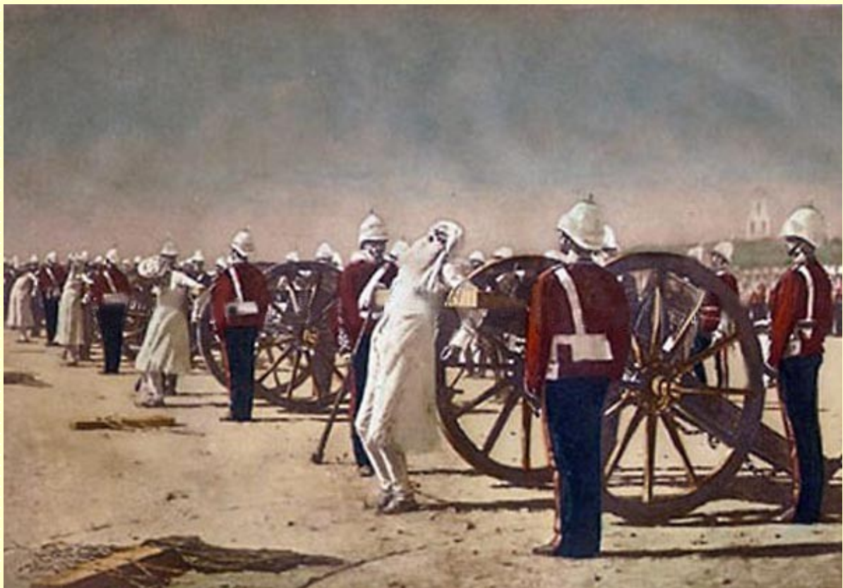
Жестокото потушаване на Сипайското въстание

Ужасните изтезания, на които беше изложена цялата страна и едно съзнателно подиграване с религиозните обичаи и убеждения на верните туземни войници, сипайте, бяха причината за въстанието на сипайте, което започна на 10 май 1857 год. в Мираз при Delhi и се разпространи скоро над по-голямата част на Индия. Англия имаше в ръцете си най-сетне отдавна желаните маши за потискане на последните стремежи към свобода у изгладнелия народ. Продължаващото от 1857 до 1859 год. въстание беше безмилостно потушено с потоци от кръв, а бунтовниците бяха завързани пред дулата на топовете и разкъсани. Същевременно Англия използва този момент, за да обяви на 1 ноември 1858 год. присъединяването на цяла Индия към Великобритания. По този начин грабежът бе санкциониран за вечни времена.