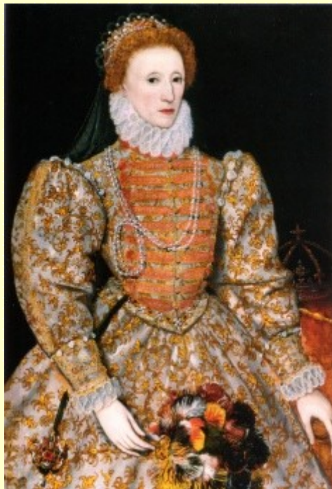
Елизабет I Тюдор (1558 - 1603)

Истинската трагедия на Ирландия започна, обаче, едва при царуването на кралица Елизабет (1558-1603); на същата тая кралица, която заповяда на своите пиратски флоти да изнудят бреговете на Западна Индия и да ограбят испанската сребърна и търговска флота. „Ирландия има хубав дървен материал и удобни пристанища, и ако испанците я завладеят, тогава те биха станали в късо време господари на моретата, върху които е основана нашата мощ”, се казва с хладнокръвна пресметливост в подготвителното обяснение на английското правителство. В този смисъл започна подновеното нахлуване, и тъй като то представляше вследствие нищожния брой войски много големи опасности, то британските водачи унищожиха на бърза ръка населението на цели местности чрез глад и меч и превърнаха цялата област, която не бяха в състояние да задържат и окупираат, в пустиня. През царуването на Елизабет 1 500 000 ирландци са станали жертва на „благочестивите” британци.