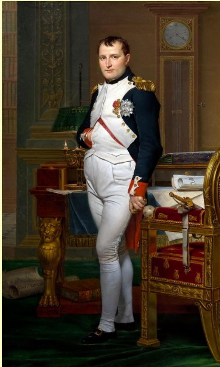
Наполеон Бонапарт (1769 – 1821)

подстрекателство бе убит в Русия цар Павел I, за да се нанесе на съюза последния решителен удар.