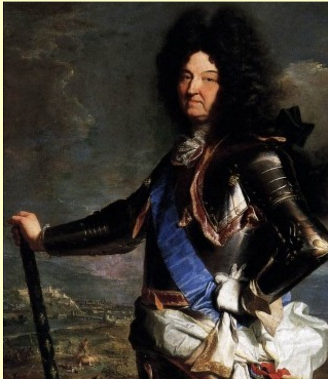
Луи XIV наричан още Кралят Слънце (1638 - 1715)

Съществуването и мощта на френския абсолютизъм при Лудвиг XIV беше станала за британското островно кралство към края на 17 век цял кошмар. Френското стопанство и търговия бяха направили нечуван напредък при меркантилната система на Колбер 1 , който намираше отдушник в растящо разширение на континента и презморските страни и застрашаваше свещените сфери на интереси на избрания световен господар.