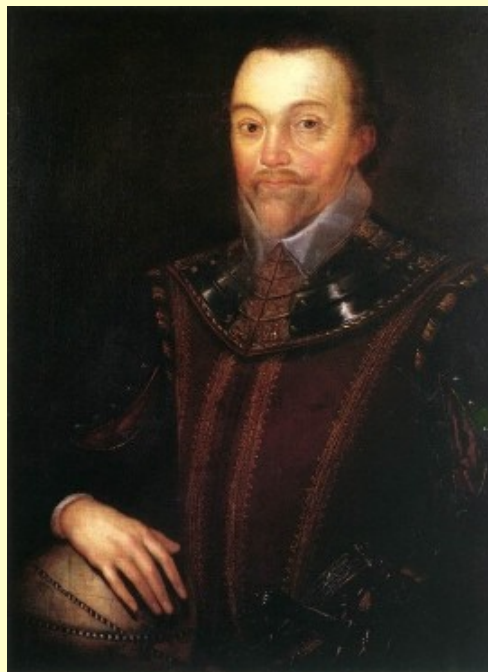
сър Френсис Дрейк (1640 – 1696)

Подвижните 197 британски кораба с най-добрите моряци и морски разбойници на страната бяха по-опитни в пиратската борба (дивите морски кучета Хокинс, Дрейк, Фробишер, Райли и др. участваха също в борбата под командата на адмирал Хоужърдс), а освен това британците познаваха всички скали, ветрове и течения. На 19 юли 1588 година при нос Лизарт започна борбата и пред Кале се достигна до продължаващата с цели дни кулминационна точка на отчаяната борба на тежко движещите се кораби на Армадата срещу жадните за убийство британски акули. Шест английски кораба, освен това бушуващите бури, причиниха голяма суматоха. Сутринта на 30 юли се биеха още само 40 испански кораба при Гравелинген, но и те бяха разпръснати от нови бури. Те бяха закарани до ирландските и шотландските брегове, а някои захвърлени даже дори до норвежкото крайбрежие.