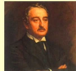
Сесил Родес (1853 - 1902)