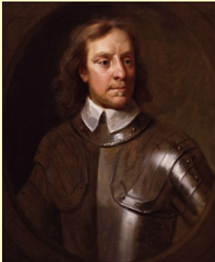
Оливър Кромвел (1599 - 1608)

претърсване и конфискуване на всички чужди кораби и освен това, ако товарът им се стори достатъчно ценен, правото на взимане, за себе си като признат владетел на световните морета.