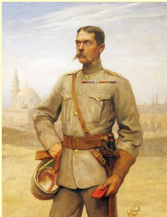
лорд Херберт Киченер (1850 – 1916)

XIX столетие е редица от британски войни на африканска земя от Египет чак до Капланд, които Англия води, за да завладее черния континент, последния незавладян още от нея. През септември 1795 две английски флоти бяха взели на холандците Капшат и цялото владение на Нидерландското източно-индийско дружество. Капшат, най-важната точка по пътя за Индия, бива официално анексиран през 1806 година. От 1836 год. Англия воюва с Натал, през 1868 год. със страната Базуто и анексира и двете области. През 1868 год. следва победоносната война с Абисиния, и на 1874 с Ашантите. През 1879 год. биват унищожени в кървав поход племето Зулу и през 1884 сомалийците и двете страни стават плячка на англичаните. На 11 юли 1881 год. Англия започва война срещу арабската национална партия в Египет и Судан с обстрелването на Александрия. След тежки поражения и след падането на центъра на английската мощ, Хартум, на 1885 год. лорд Киченер унищожава в безмилостен поход (1898-99) в битките при Омдурман и Ом Дебрикат, при които падат под английския картечен огън десетки хиляди арабски борци за свободата на нилските жители.