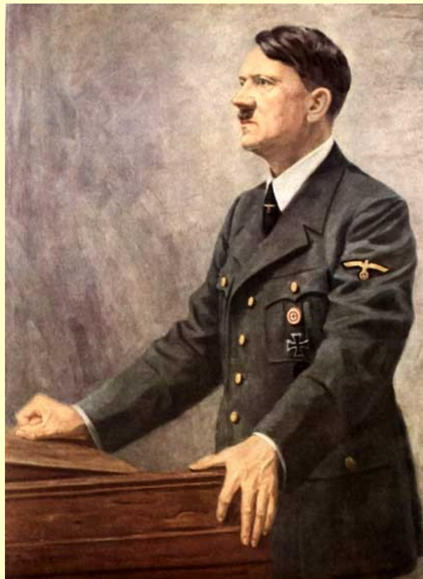
Адолф Хитлер – Водачът на Нова Европа

Световната история ще напише с германското оръжие присъдата над Англия.